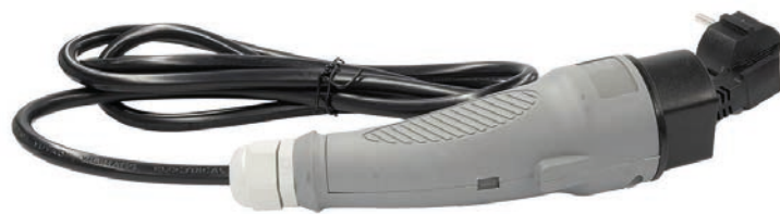
Ladekabel : 135178 - Ladekabel til Urban/Country 230V

BEMÆRK! Bruger du en forlængerledning, skal du være ekstra opmærksom på samlingen mellem opladeren og forlængerledning ikke bliver udsat for vand og fugt.